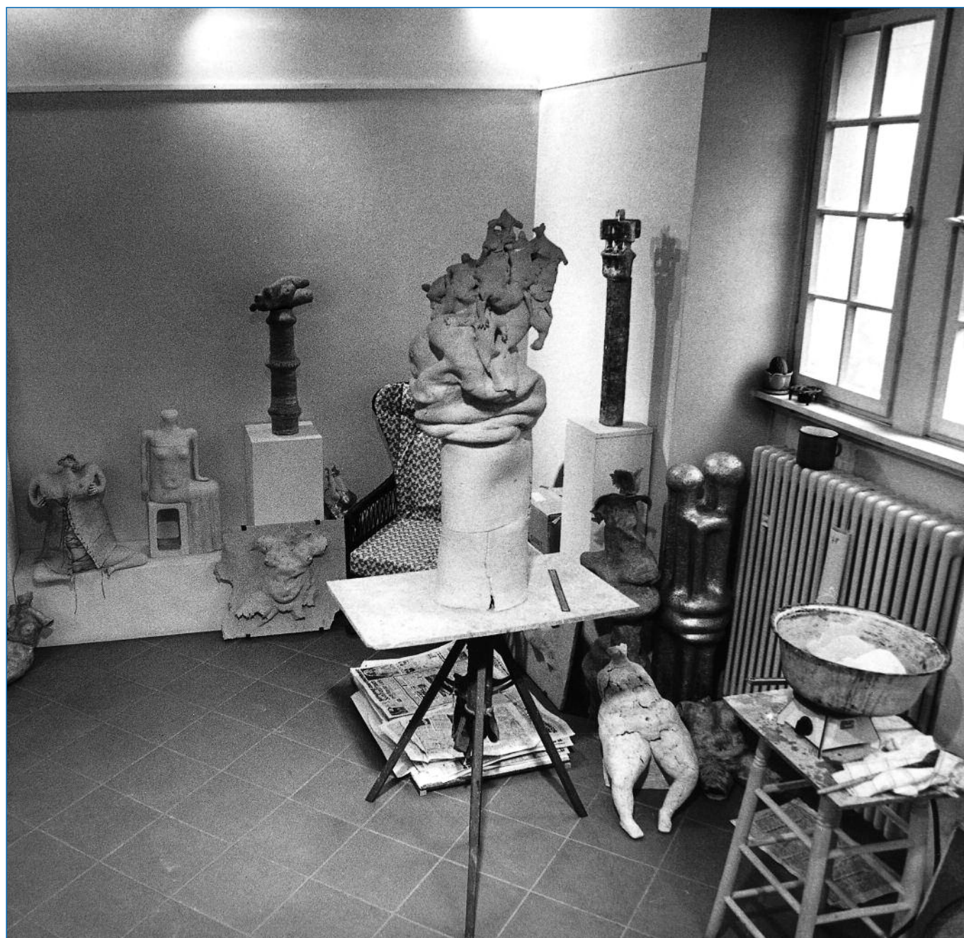
Blick in das Atelier von Inge Blum im Eisenturm (70er Jahre des 20. Jhs.).

Vorstand des Kunstvereins Eisenturm im August 2010